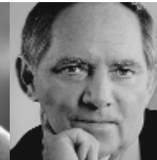
Wolfgang Schäuble 1998–2000