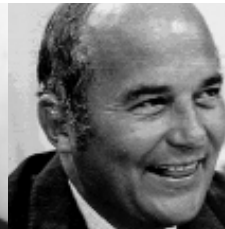
Rainer Barzel 1971–1973