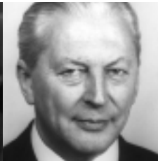
Kurt Georg Kiesinger 1967–1971