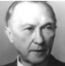
Konrad Adenauer 1950–1966