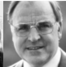
Helmut Kohl 1973–1998