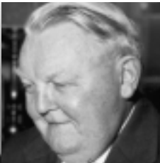
Ludwig Erhard 1966–1967